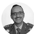
Jesús Díez Alcalde Col. Ejército Tierra Periodista y Geopolítico