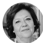
IMPARTIDO POR: Trinidad de Antonio Doctora en Historia del Arte

El arte barroco se desarrolló en España a lo largo del siglo XVII y parte del XVIII, siguiendo la influencia italiana, pero con una intensa y original personalidad. Fue una de las etapas más fructíferas de la creación artística en la Península, como consecuencia de la profunda religiosidad de un pueblo y el protagonismo de la Corona, que encontraron en los recursos y valores estéticos del Barroco el camino adecuado para expresar sus ideales y defender sus intereses.